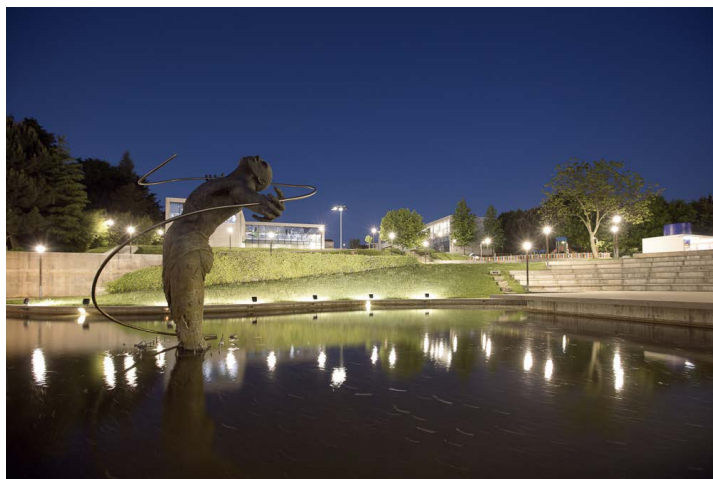
Proyecto implementado en 2018.

El desafío propuesto era iluminar adecuadamente el municipio, ofreciendo calidad y seguridad a los ciudadanos, alcanzando las metas de sostenibilidad energética y ambiental, sin implicar una inversión superior a la marcada por el presupuesto de la alcaldía.